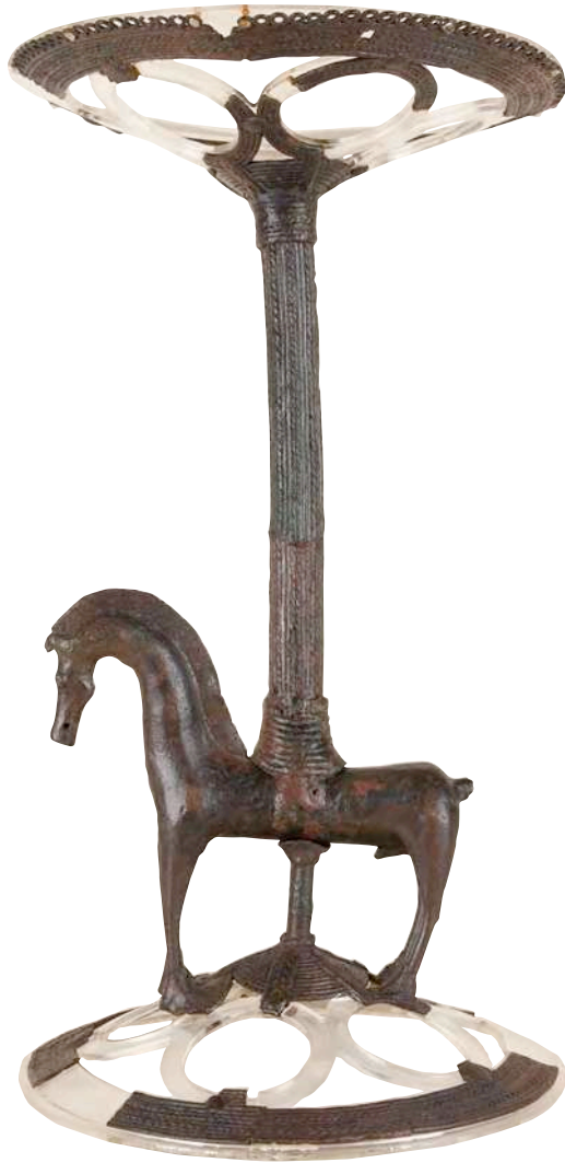
^ Timaterio de Calaceite