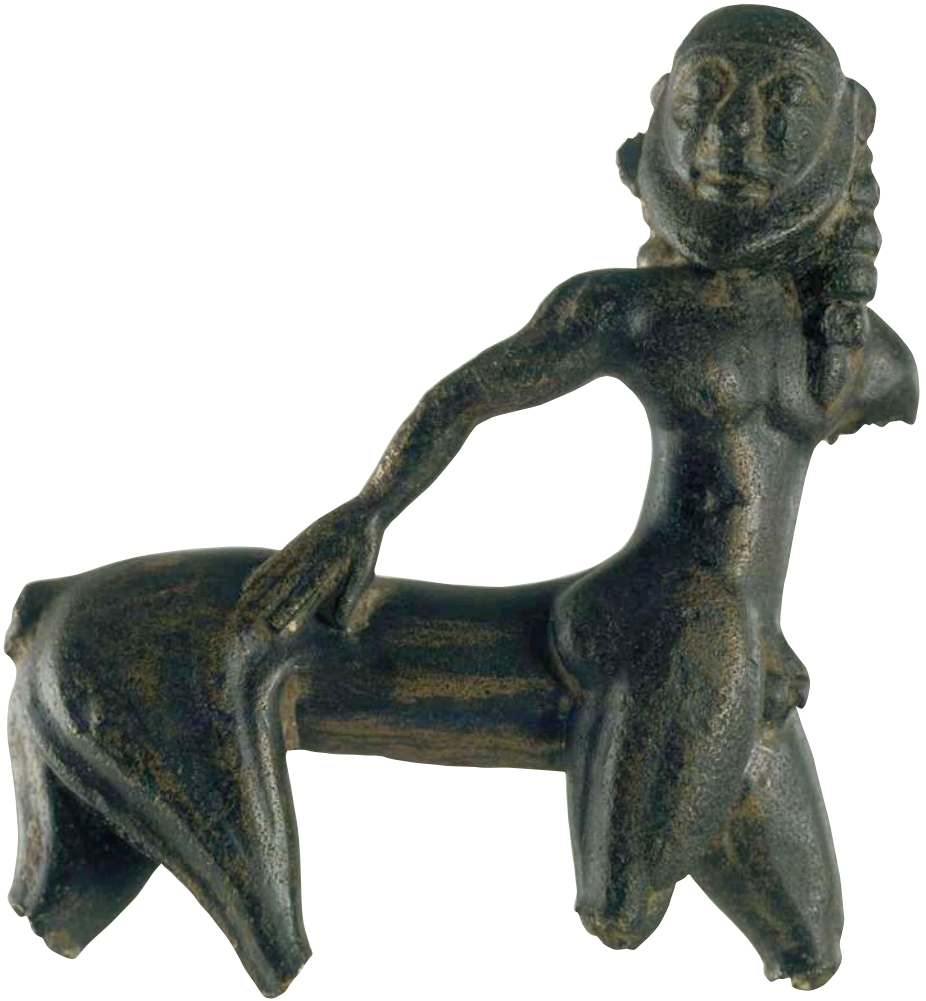
^ Centauro de Royos

Los grupos ibéricos se organizaron en pequeños estados, desarrollando fórmulas sociales jerarquizadas, basadas en el dominio de la tierra y sus recursos, así como en el control del comercio. Generaron nuevos modelos de poblamiento, visibles en las maquetas expuestas, con centros principales que se convirtieron en capitales de territorios políticos, rodeados de asentamientos menores agropecuarios, mineros, comerciales o defensivos. Este proceso implicó el desarrollo de vías de comunicación, de sistemas de pesos y medidas, de la escritura y más tarde de la moneda. Piezas como la rueda de carro de Toya ayudan a documentar la jerarquización de la sociedad, pues son príncipes o aristócratas quienes encargan esos objetos, o se entierran en tumbas monumentales.