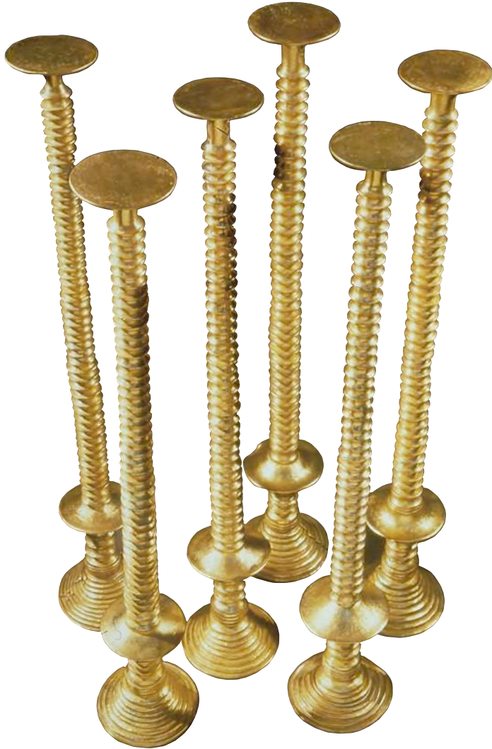
^ Timaterios de Lebrija