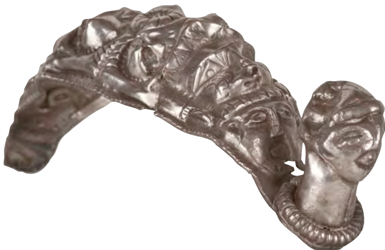
^ Fibula de Driebes

La compleja organización social se refleja en la religiosidad ibérica. Tanto en el Castellet de Bernabé como en el Puntal dels Llops se han identificado capillas relacionadas con cultos domésticos o familiares. En otros lugares se han localizado enterramientos infantiles bajo los suelos de las casas o sacrificios de animales relacionados con la fundación del recinto.