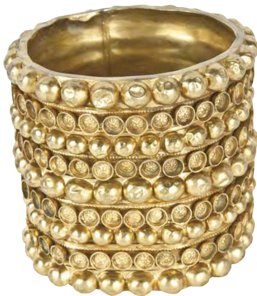
^ Tesoro de El Carambolo. Pulsera

Fue una etapa revolucionaria en el más estricto sentido del término, pues las poblaciones indígenas pusieron en práctica con rapidez y eficacia todo el conocimiento tecnológico que les transmitieron los fenicios, además de reordenar el territorio y establecer nuevos mecanismos de poder. Su economía tuvo una base agropecuaria, junto a una intensa explotación minera, especialmente de plata y estaño, destinada a satisfacer la demanda de los colonizadores fenicios. Se fundan palacios y santuarios inspirados en modelos del Mediterráneo oriental, como el santuario de El Carambolo y surge una nueva sensibilidad religiosa que asimila formas culturales complejas, dando cada vez más importancia a la visibilidad de las necrópolis, mientras sus divinidades parecen adoptar rasgos tomados de los colonizadores orientales. Destaca por su importancia del tesoro de Aliseda, ajuar de enterramiento de dos aristócratas.