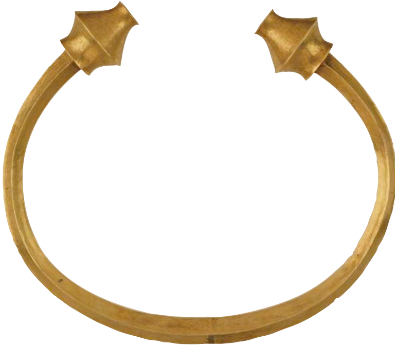
^ Torques de Ribadeo

jarras o braseros; de adorno, complemento de la indumentaria masculina y femenina; y armas defensivas.