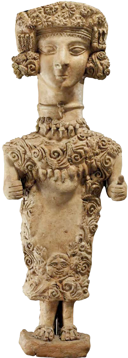
Dama de Ibiza >

Otro aspecto de la religiosidad púnica son los santuarios que en origen estuvieron dedicados a Astarté, la diosa fenicia protectora de los navegantes, y más tarde, a partir del siglo VI a. C., quedaron bajo la advocación de Tanit, la nueva divinidad del panteón cartaginés que tenía atributos similares.